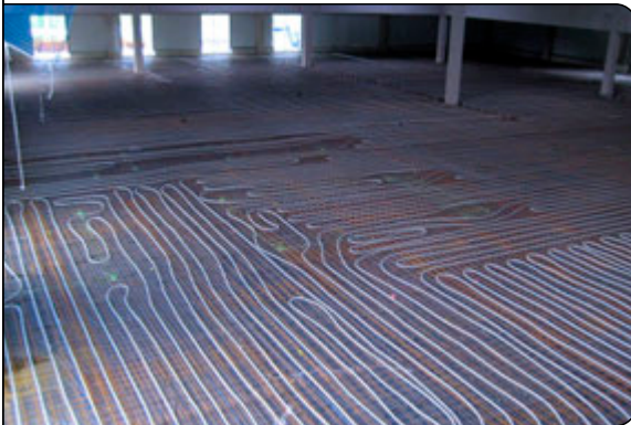
Blick auf die Verlegung der Heizrohre